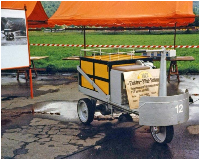
1988 Grand Prix Formule E Emmen