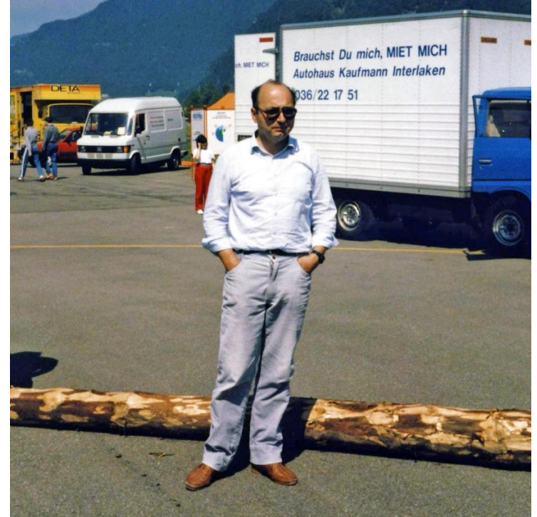
1987 Grand Prix Formule E Emmen