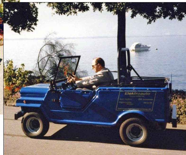
1986 AG UCS