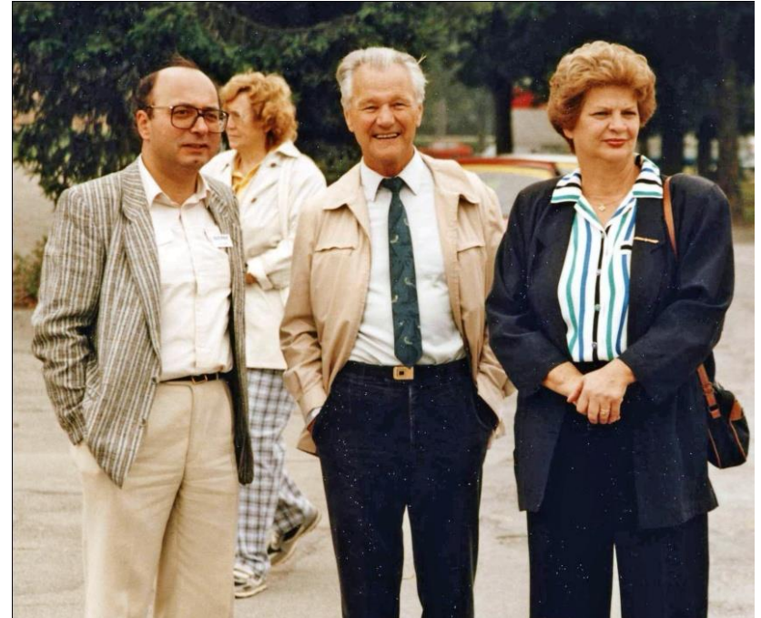
1991 Championnat On-Road Berne