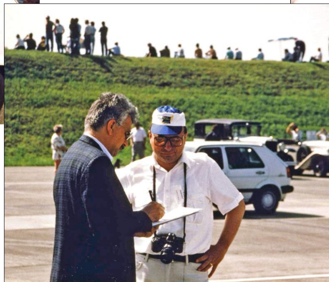
1993 Grand Prix Formule E Emmen