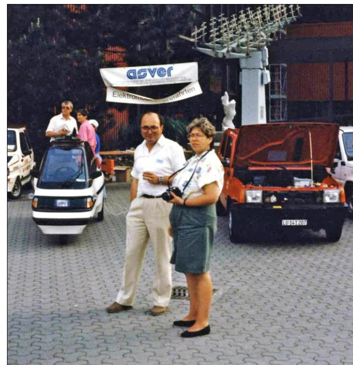
1989 Journée d'ouverture du Grand Prix Suisse de Formule E au Musée des Transports