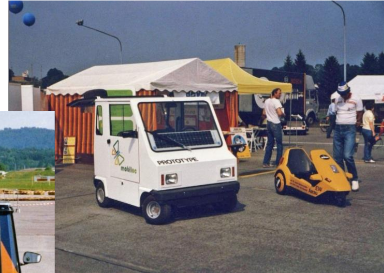
1989 Grand Prix Formule E Emmen