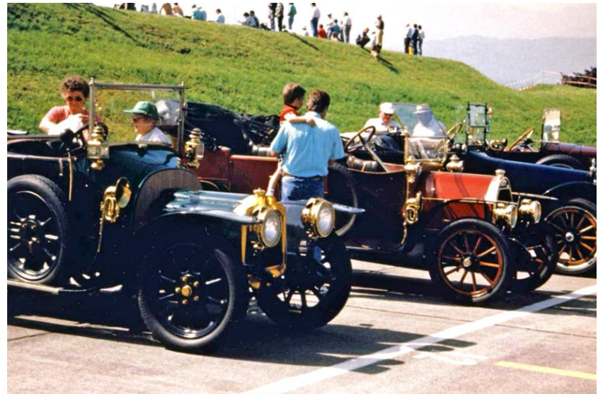
1993 Grand Prix Formule E Emmen